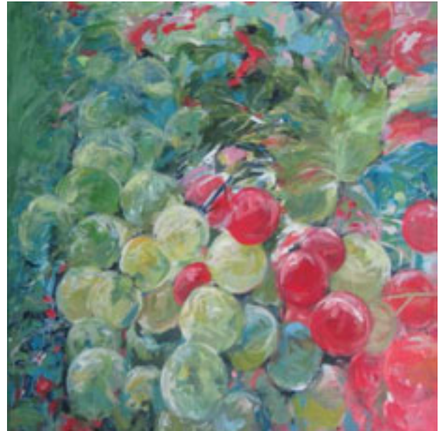
"Weintrauben" | Pigmente und Acryl auf Leinwand | 2009

Für meine Bilder wende ich eine von mir entwickelte Mischtechnik aus Acryl -und Pigmentfarben an. Anhand von Fotos oder sonstigen Vorlagen werden von mir Kompositionen erstellt, die ich in eine freie oder gegenständliche Bildsprache umsetze.