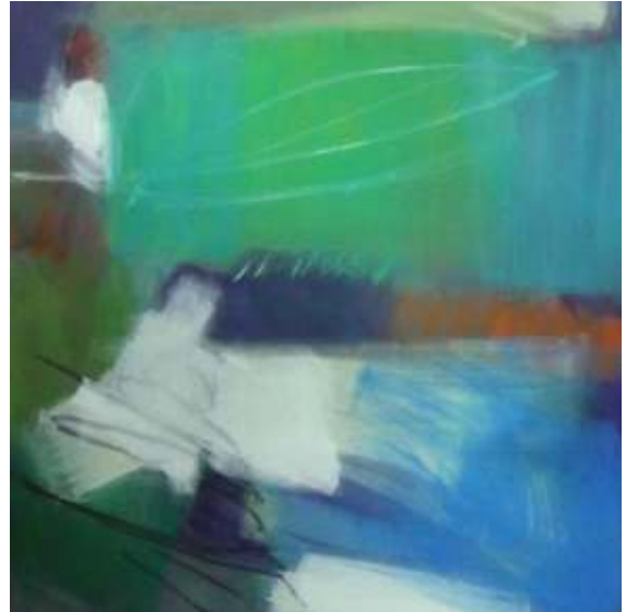
o.T. | Pigmente und Acryl auf Nessel | 2010 Ausschnitt