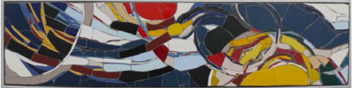
Zwei Planeten | Mosaik

Die beiden Materialien mit denen ich hauptsächlich arbeite, sind das Mosaik und Eisen. Zur Mosaiktechnik kam ich ursprünglich durch die kunsttherapeutischen "Mosaikprojekte" mit Klinikpatienten. Inzwischen hat die Mosaikarbeit einen festen Platz auch im eigenen Atelier. Eisen ist fest, schwer und hart. Trotzdem kann es schweißtechnisch zu einer filigranen Form aufgebaut werden. "mit der Schwere in die Leichte"