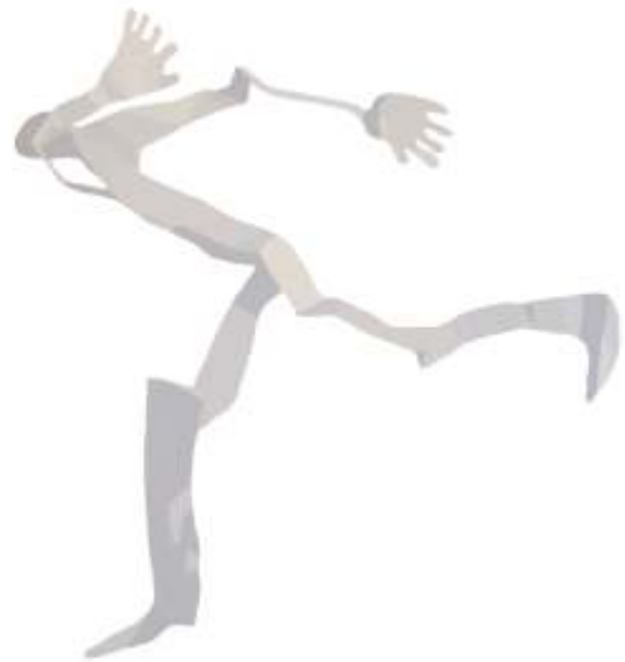
Raumgestalt | H 28 cm | Eisen gebogen, lackiert | 2009 Raumgestalt | 60 cm x 80 cm | Graustuf endruck aus verlorener Form | 2009

Gegenstand meiner Arbeit ist nicht der anatomische Mensch sondern das Wesen Mensch. Die innere und äußere Bewegung als Grundlage einer Entdeckungsreise Mensch, als Ausgangspunkt für Veränderung und individuelles Handeln im positiven Sinn. Der Aufbruch aus erstarrten Strukturen, nicht zuletzt auch mit Humor.