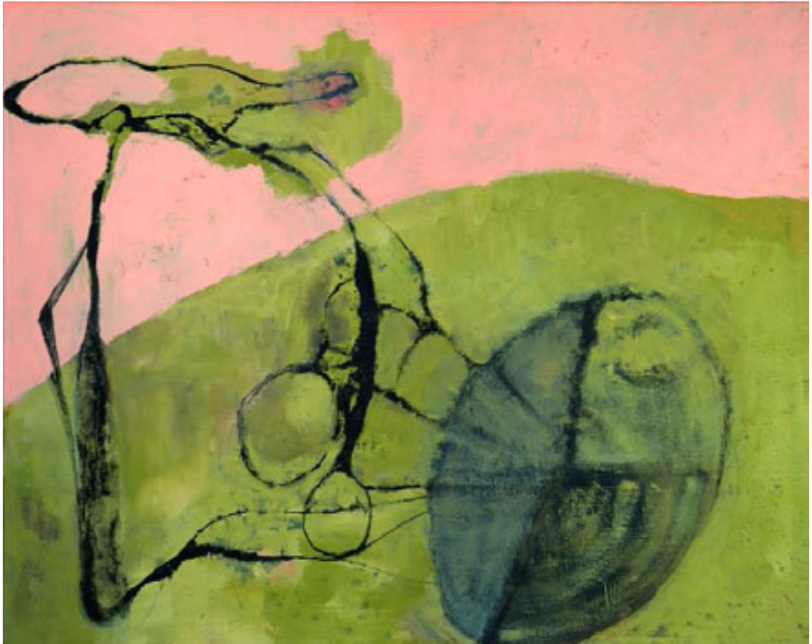
Unmögliche Fahrräder I

Der Phantasie freien Lauf lassen ist der Ansatz für meine Malerei. Malen ist für mich ein Spiel mit Formen und Farben. Auch ohne deutliche Gegenständlichkeit kann das Bild eine Aussage haben.