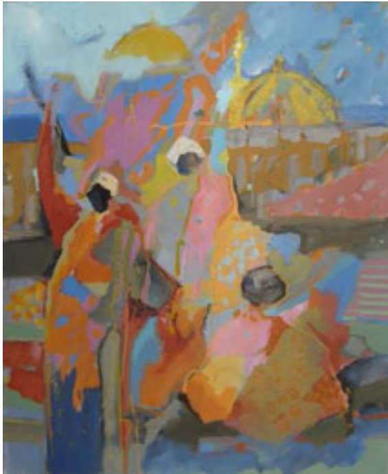
Colours of India I | 100 x 80 cm | Acryl u. Pigment/ Leinwand