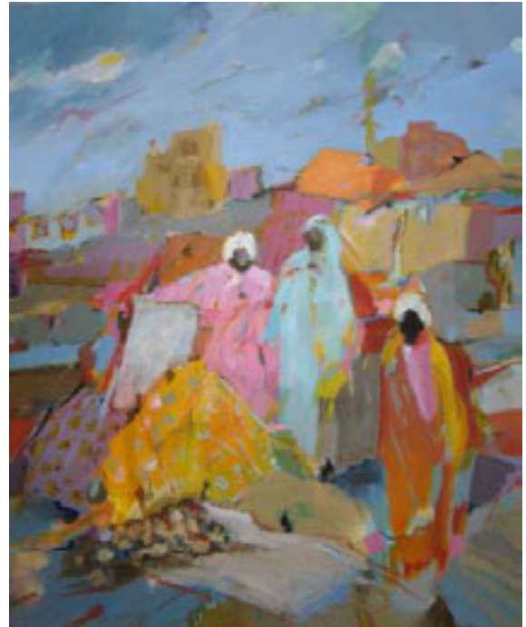
Colours of India II | 100 x 80 cm | Acryl u. Pigment/ Leinwand

Derzeit gestalte ich hauptsächlich Reiseimpressionen von meinen jährlichen Indienaufenthalten. Die Farbenpracht indischer Märkte ist ein Thema, das mich besonders fasziniert. Ich verwende keine Skizzen oder Fotografien, sondern versuche momentane persönliche Eindrücke, Empfindungen und Erfahrungen wiederzugeben, indem ich diese inneren Bilder nachträglich in meinem Atelier in äußere Bilder umsetze.