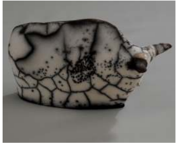
Schale Stier | Keramik-Raku | 2010 | ca. 40 cm Durchmesser Stierchen | Keramik-naked Raku | 2010 | ca.: 7 x 12 cm