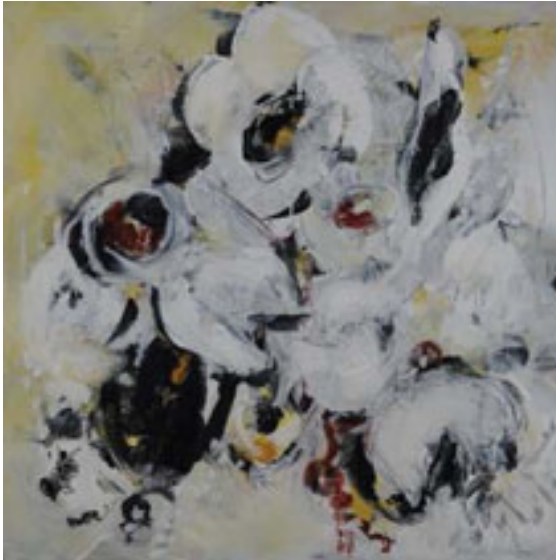
FLORA 6 / Acryl / 100 x 100 cm