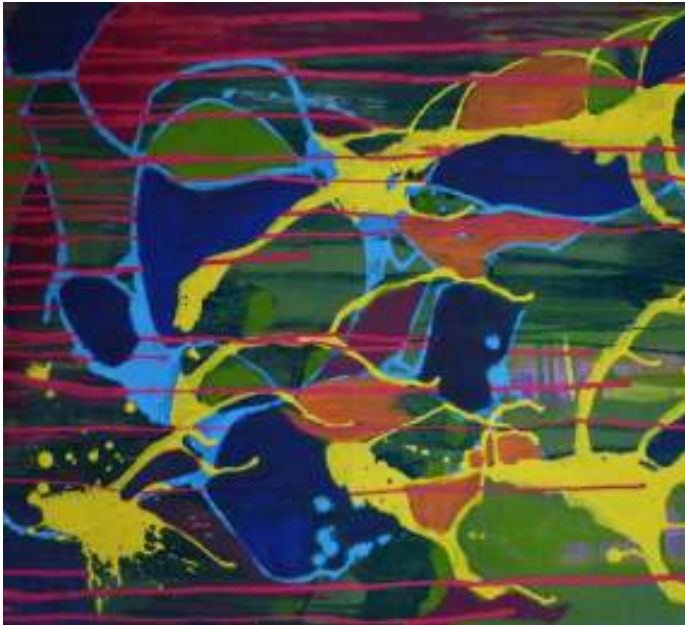
"Luftzug" | Acryl auf Leinwand | 70 x 100 cm