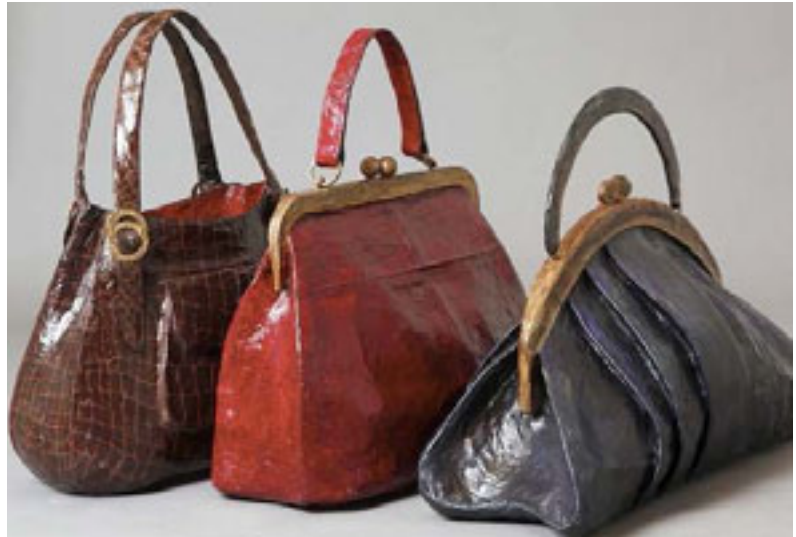
Taschen 2010/11 | Papier Mischtechnik | 50 x 70 und 55 x 75 cm

Zur Zeit arbeite ich an zwei Projekten. Das eine Projekt ist die Fortsetzung der bereits bestehenden Serie überdimensionaler Modeaccessoires (Taschen, Schuhe, Korsett) in Papier-Mischtechnik, die rein aus Freude am Material (Aufarbeitung meines Zeitungs-Abos) und Überraschungseffekt - durch die Größe - entstehen.