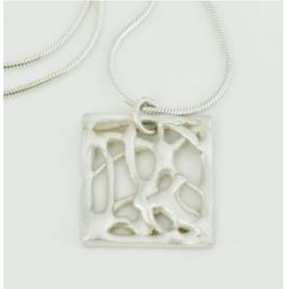
Anhänger, Silber, 2010

Bei meinen Fotografien geht es mir um die Darstellung von Form, Raum und Situationen, die sich oft im Verborgenen befinden. In meinen Fotografien „Wasserzeichen“ beschäftige ich mich in abstrakter Weise mit dem Element Wasser und seinen Eigenheiten als Spiegelement, das verschiedenste Auswirkungen in Nachbildung und Verzerrung des Raums bis hin zur Entmaterialisierung der Formen zeigt.