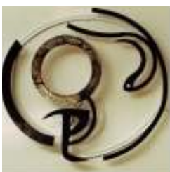
Burkhard Garben Objekte / Mosaik Haus A, EG 01520 / 187 7938 burkhard_garben@ web.de