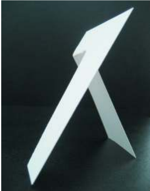
"Schreitender", Eisen, 200 x 80 cm