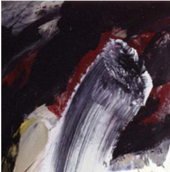
Ausschnitt aus Arbeitstitel "J 12" | 200 x 320 cm | Acryl / LV