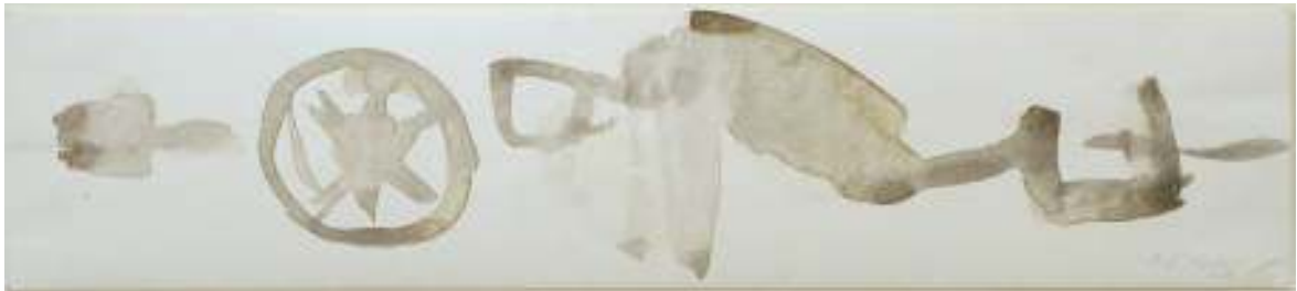
Mensch und Rad | Aquarell

Elke Wilhelms zielt auf die Veranschaulichung der in der Natur enthaltenen poetischen Möglichkeiten. Sie zielt auf das visuelle Gedicht.