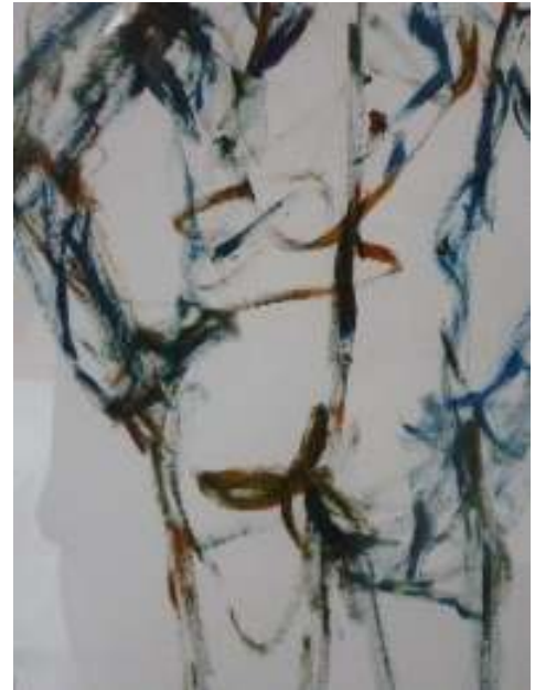
"Rück enakt" | Acryl auf Papier | 40 x 30 cm

Aktmalerei und abstrakte Malerei auf Papier und Leinwand, Kunsttherapie