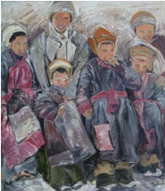
"Kinder aus Burma" | Pigmente auf Leinwand | 2009