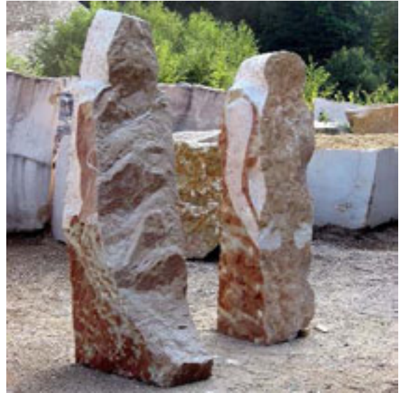
Wächter d. Friedens | Hüterin d. Lebens | Untersberger Marmor | 2008

Meine Malerei entsteht nicht aus dem Gegenständlichen, schöpft nicht aus der Natur, hat keinen abstrakten Anspruch. Dynamik, Bewegung, Verdichtung, Gegensätze und Ihre Differenzierungs-stufen erzeugen meine Bildwelten.