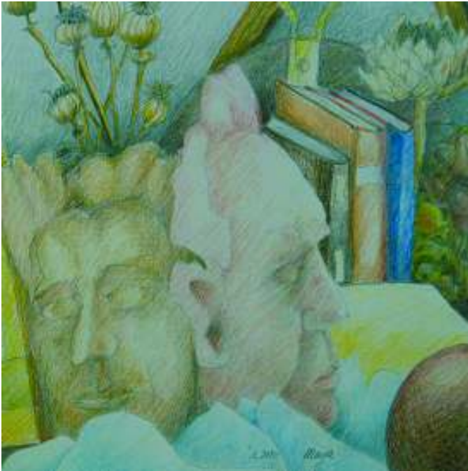
Masken | Farbstiftzeichnung