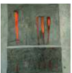
Erika Pusch Malerei Haus A, I. OG 089 / 850 6654