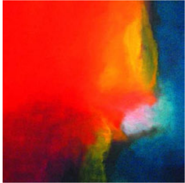
"Coucher du soleil", Eitempera, 100 x 100 cm

Meine Arbeiten in der Malerei sowie in der Bildhauerei sollen die Kraft der statischen Fläche in der Begrenzung zeigen. So entsteht ein Gefühl für Dimensionen, Endlichkeit und Unendlichkeit. Die Erde, das Wasser, der Himmel - die Landschaft -, das was mich umgibt, sind der Inhalt meiner Bilder. Die Farben - Eitempera mit Pigmenten - unterstreichen die wechselnden Eindrücke der immer gleichen Thematik. Es ist mein Wunsch und Absicht, daß der Betrachter sich in mein Werk einliest, einsieht es umfaßt und somit erfaßt - für ihn und auch für mich.