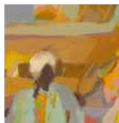
Regina Lord Malerei Haus C, I. OG 0172 / 8171565 www.regina-lord-artwork.de