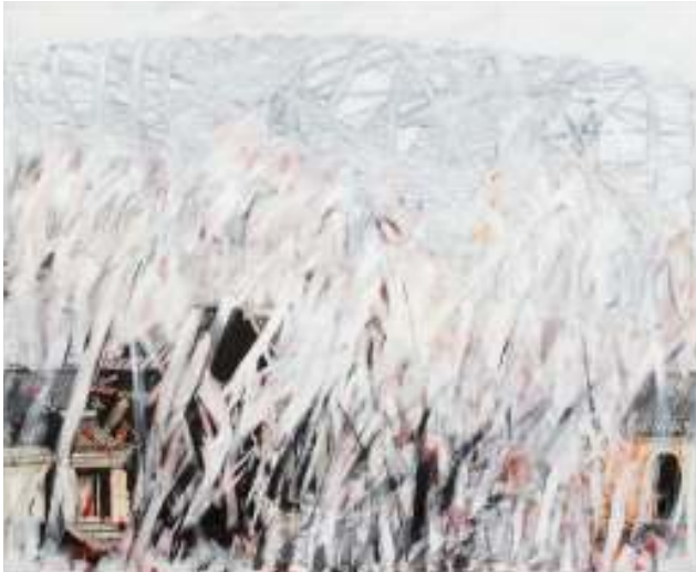
“One world one dream” | Acryl/Leinwand | 180 x 230 cm | 2009