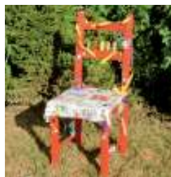
Beate Becker Stuhlobjekte / Malerei Haus A, DG 0151 / 17298832 be.becker09@ googlemail.com