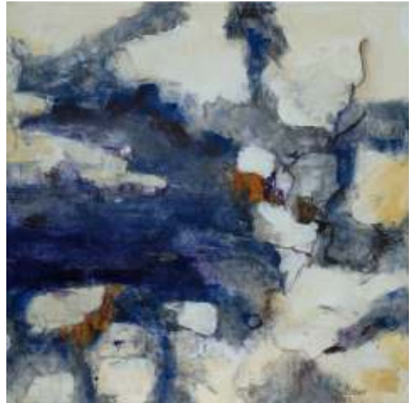
Wintersteine I und II | Acryl auf Leinwand, je 100 x 100 cm