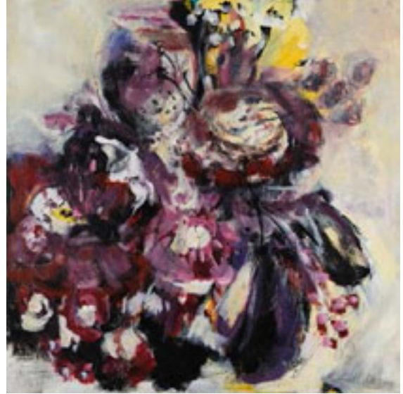
FLORA 2 / Acryl / 100 x 100 cm