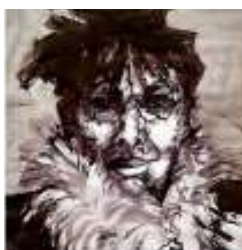
Susanna Weichselgartner Zeichnung / Malerei Haus C, DG 0163 / 170 9776 www.suweiarths.de