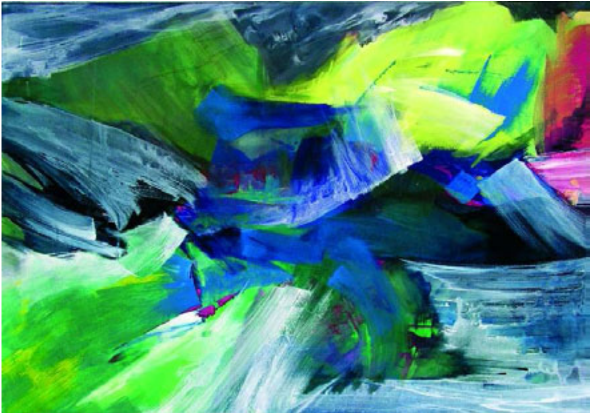
o.T. | 70 x 100 cm | Pigment auf Leinwand

Meine Bilder sind nichts als Bilder. Sie vermitteln keine Botschaft und geben keine Rätsel auf. Sie sind nicht gedanklich entworfen, nicht unbedingt geprägt von abstraktem Intellekt. Vielmehr eine unentwegte Folge von Sedimentierungen, Aufbrüchen, das beständige sich Ablagern bildnerischer Energie auf dem Weg zu einem Bild, das sich erst am Ende zeigt.