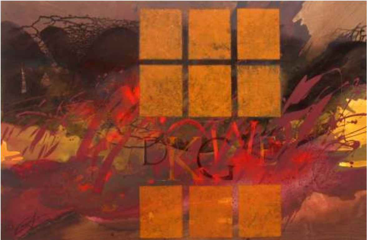
o. T. | Acryl-Mischtechnik | 80 x 120 cm

Meine neue Serie beschäftigt sich mit „Schriftbildern“. Worte, Texte, Aphorismen, die in mir etwas zum Klingen bringen, in einen spannungsvollen Bezug von Stimmung und Aussage zu bringen, ist für mich eine interessante Herausforderung.