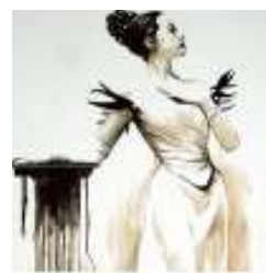
Jon C. Torre Malerei / Illustration Haus C, I. OG 0173 / 8927912 www.jctorre.com