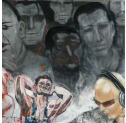
“Volume” | Acryl/Leinwand | 100 x 100 cm | 2008