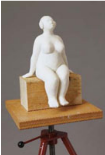
Mona mit Kopfhörer 2011 | Ton | 28x42 cm