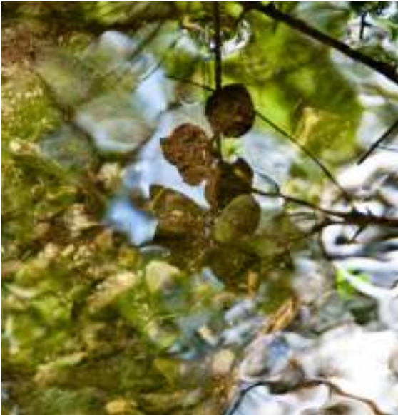
Wasserzeichen, Fotografie, 2010

Bildhauerei | Fotografie | Schmuckobjekte