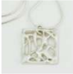
Veronika Klaus Schmuckobjekte / Fotografie Haus A, Quergebäude I. OG 01522 / 954 0632 www.veronikaklaus.de