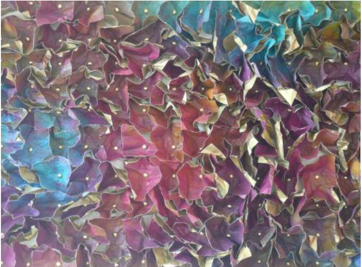
Verdichtung I / Acryl auf Papier auf Holz / (Detail) 120 x 65 cm / 2011

Neben den gemalten Farbräumen zeige ich als aktuellen Schwerpunkt Wandobjekte, in denen ich das Konzept der Erforschung von Farbwirkungen in die dritte Dimension weiterführe: im Zyklus "Verdichtung" male ich zunächst ein Bild auf Leinwand oder Stoff. Dieses Bild "dekonstruiere" ich, indem ich es zerreiße oder zerknülle. Dann folgt die "Rekonstruktion" der Fragmente auf einer Holzplatte. In dem Objekt entstehen die Farben und die Formen des Ursprungsbildes neu: verfremdet, intensiviert, rhythmisiert - eben verdichtet.