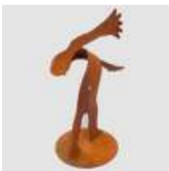
Ulrich Schweiger Skulptur / Graphik Haus A, EG 0177 / 657 9534 www.ulrich-schweiger.de