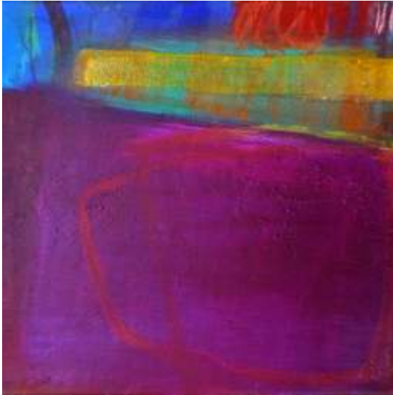
o. T. | Pigmente und Acryl auf Nessel | 2010 Ausschnitt